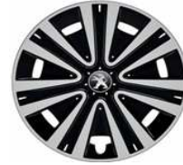
Embellecedor 15" NATEO