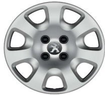
Embellecedor 15" ATACAMA