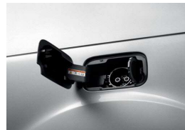
Trampilla de carga rapida