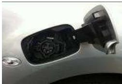
Trampilla de carga normal