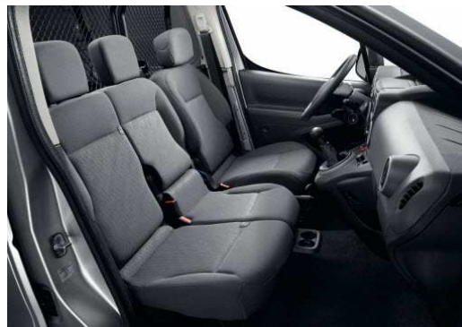
Banqueta pasajero dos plazas con asiento Multiflex*